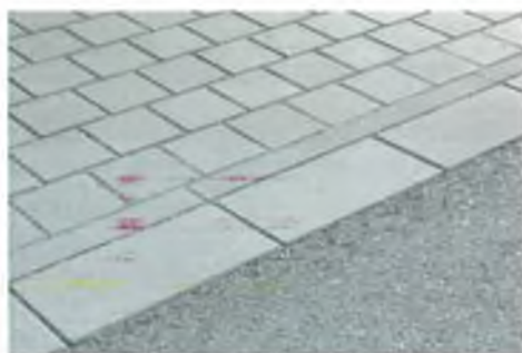
A+B Obytná zóna