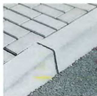
A+B Zóna 30