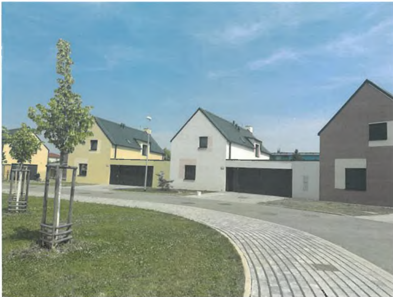
Kombinace soukromých předzahrádek domů, veřejné zeleně se stromy, vyasfaltovaného dopravního prostoru a betonové dlažby pro chodníky (parkovací plochy). Autor: Pavel Hnilička architekti a plánovači (lokalita Újezd nad Lesy).