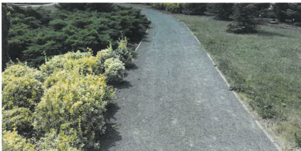
Mlatový povrch přírodních cest.