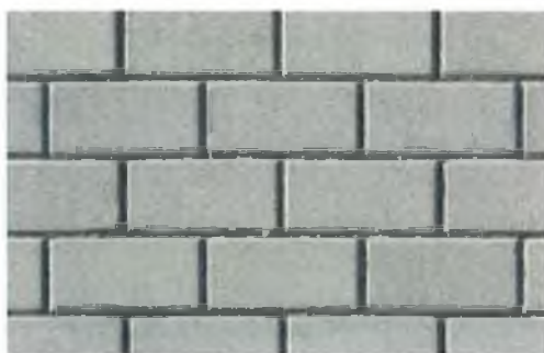
A Betonová dlažba